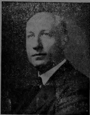
El señor Truslow

NUEVA YORK.—El abogado neoyorkino Francis Adams Truslow, quien es bien conocido en las repúblicas americanas por su labor durante la guerra, dirigirá las operaciones del Curb Exchange (o Bolsín) de Nueva York, que es el segundo mercado de valores más importante del país.